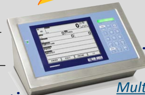
Multifunktionale Gewichtsanzeigergerät 3590EGT