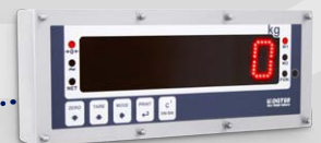
Gewichtsrepeater mit großer Anzeige DGT60