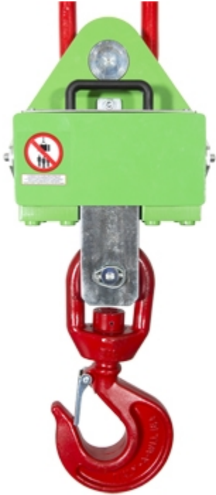
MCWHU: Sicht vom hinten